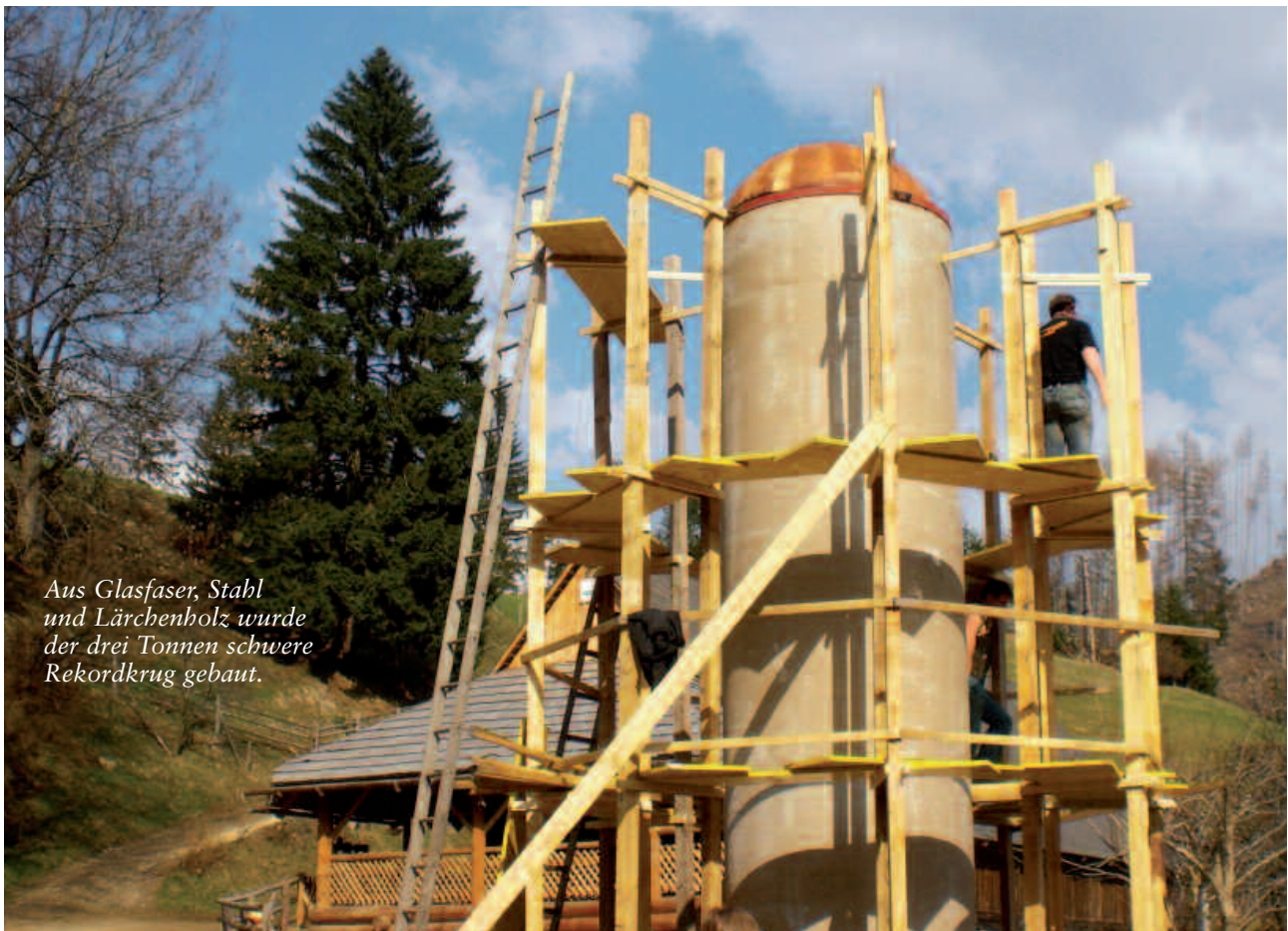
Aus Glasfaser, Stahl und Lärchenholz wurde der drei Tonnen schwere Rekordkrug gebaut.